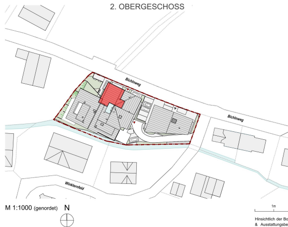
M 1:1000 (genodet)