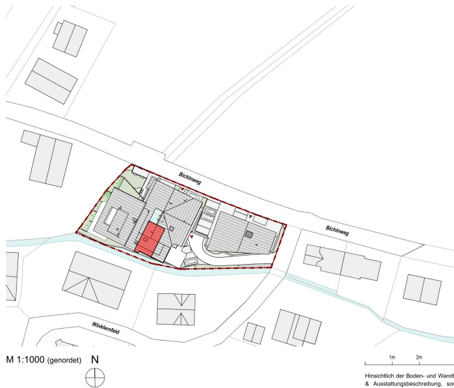
M 1:1000 (genordet) N